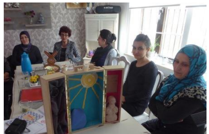
Project (on)breekbaar met een van de kistjes

Twee dames uit Tongelre gaven uitleg aan de groep 'Samen op weg' uit Gestel over wat het maken van deze bijzondere kistjes voor hen heeft betekend. De dames zijn trots op hun 'kistje', dat een stukje van henzelf laat zien. Het doel van deze OVAA-activiteit is om de dialoog op gang te brengen binnen de groep waaraan dames met verschillende nationaliteiten meedoen.