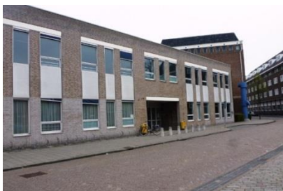
ingang Deken van Somerenstraat 4

Ons kantoor is beperkt bemand; krijgt u geen gehoor stuur dan een mailtje naar: secretariaat@ovaa-eindhoven.nl