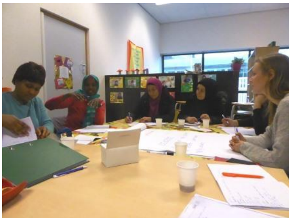
Groep 'Samen op weg'

Door het bijwonen van deze bijeenkomsten leren deze vrouwen steeds beter hun weg vinden in de Nederlandse samenleving, nemen ze steeds vaker deel aan activiteiten in de wijk en gaan ze zich echt thuis voelen in de wijk.