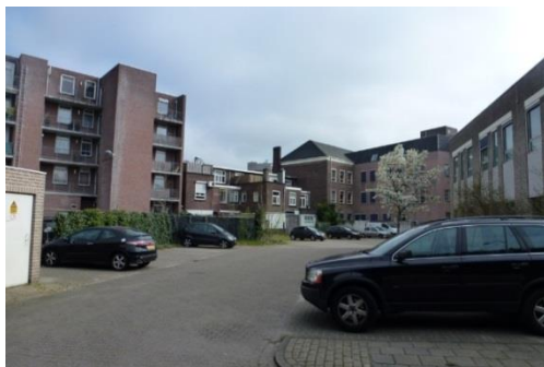
parkeerplaats achter kantoor; ingang links van gebouw