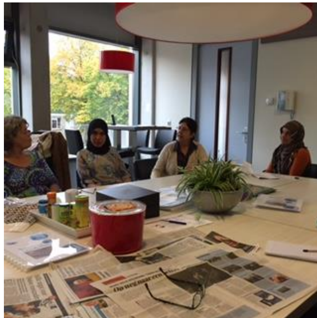
Actuele thema's worden besproken

Afrika, Iran, Azerbeidjaan, China, Soedan, Polen, Ghana, Ver. Arabische Emiraten, Taiwan, Turkije, Marokko, Syrië, Brazilië, Kazachstan, Bulgarije, Somalië, Afghanistan en Egypte.