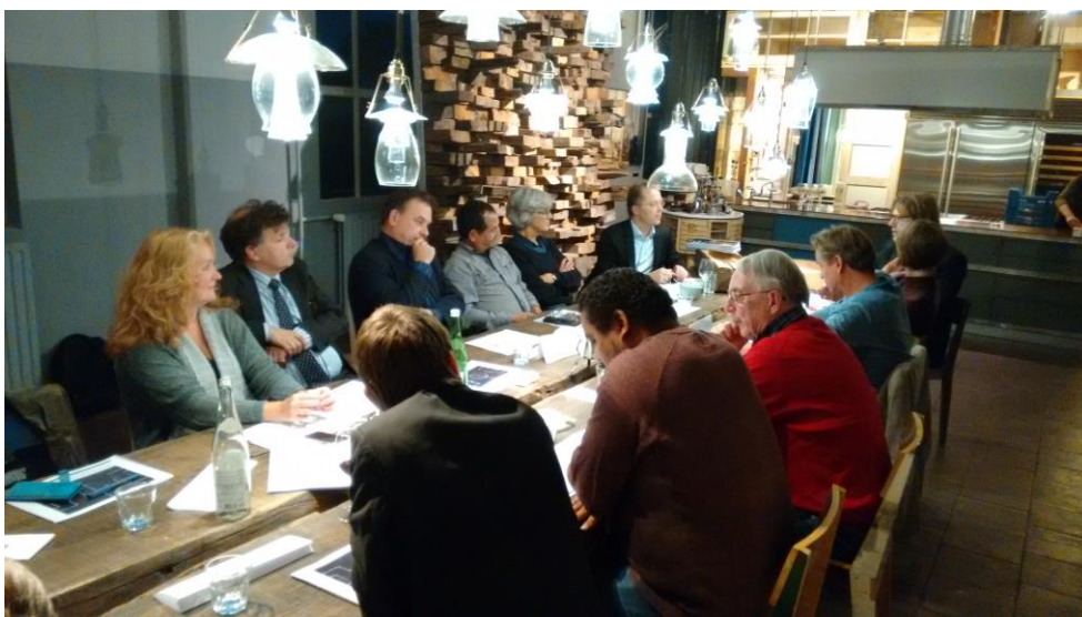
Expertsessie Cultuurbeleid gemeente Eindhoven

Dit is nadrukkelijk het geval in de wijk Woensel/Rapenland waar Stichting New Beginning, Stichting El Islaah en bewonersplatform De Raap zeer actief zijn. OVAA heeft in 2015 de fundamenten gelegd voor verdere professionalisering van wijkgericht werken en heeft geleidelijk de uitvoering van activiteiten overgedragen aan deze organisaties. Wel zijn wij ons op de achtergrond blijven inzetten voor afstemming met name daar waar diversiteit een rol speelt.