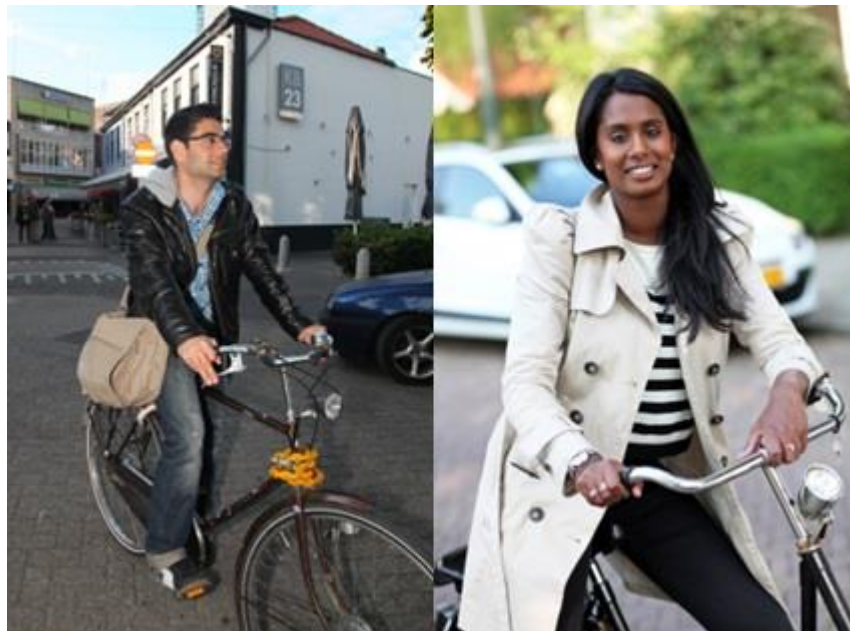
Veel vragen of OVAA fietsproject wil opstarten in 2016

OVAA maakt deel uit van de bestaande infrastructuur en zet haar deskundigheid en expertise in om de integratie- en participatieprocessen te versnellen en duurzaam te verankeren in wijkgericht werken en wijkaanpak.