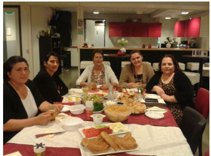
Laatste bijeenkomst Ontmoetingsochtend