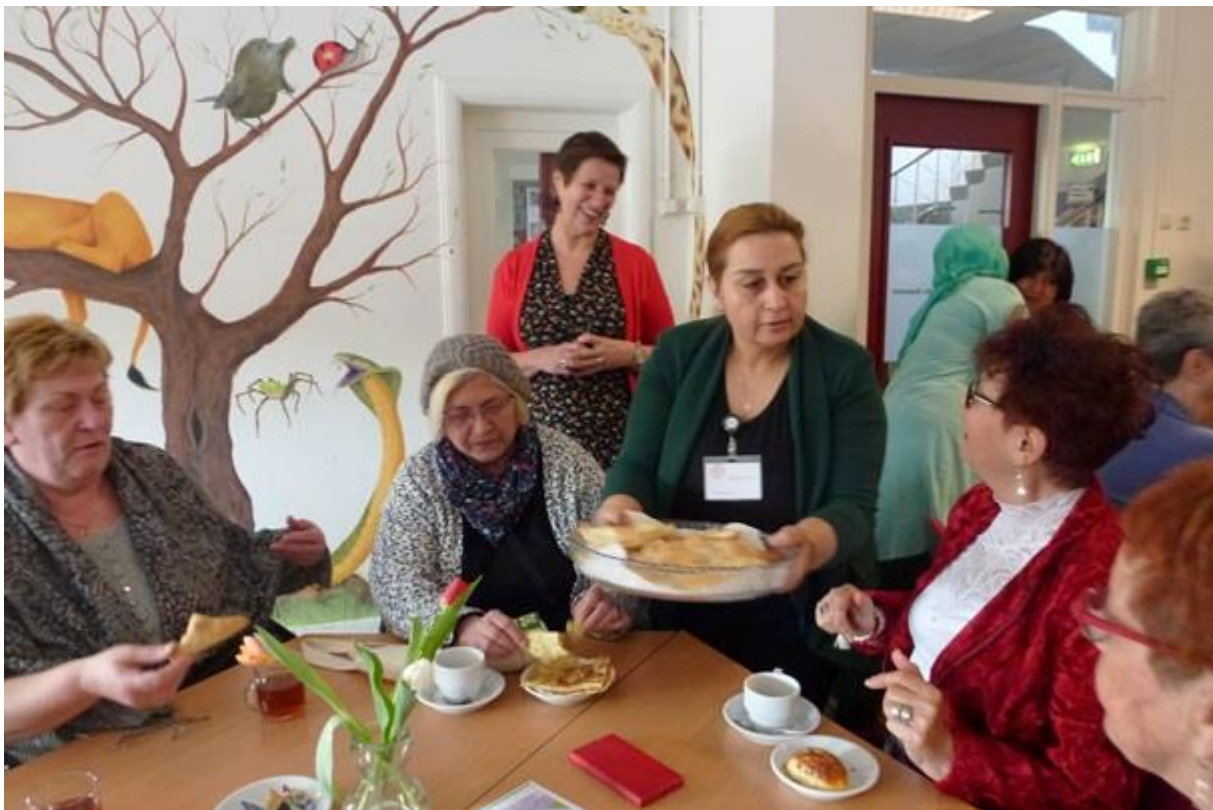
Groep Samen op Weg doet iets terug voor wijk

Project 4: Diversiteitbeleid en –management - autonoom beleid valt niet binnen subsidieaanvraag