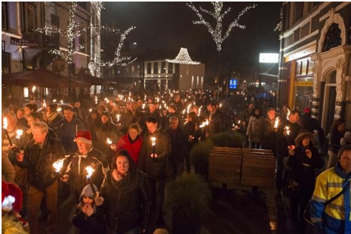
Fakkeltocht 24 december