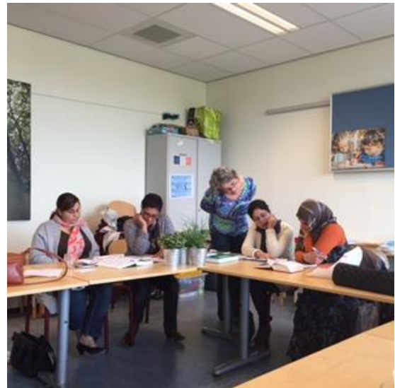
'Samen op Weg' nieuwe stijl

Werken aan eigen kracht en participatie door thema's te bespreken: